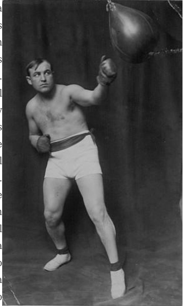
El canadiense Tommy Burns aseguró que se jugaría el título con cualquiera que lo mereciese, blanco o negro, y cumplió su palabra.

El combate fue largo, pero no tuvo demasiada historia. El hasta entonces intratable Tommy Burns aguantó el vendaval como pudo, pero Jack Johnson tenía mucha más envergadura, más técnica, mejores movimientos y una mentalidad mucho más fría. Constantemente anulaba los ataques de Burns con el clinch . Incluso se permitía el lujo de sonreír y dirigirse al público: veinte mil australianos blancos que le insultaban constantemente llamándole «payaso» y «negrata». Y sin embargo, aquel ambiente infernal parecía no hacer mella en él. Incluso se burlaba de su rival: «Pobre Tommy, ¿de verdad pensabas que eras boxeador?», «Pero ¿quién se supone que te ha enseñado a pelear?». El canadiense no podía hacer nada, porque la superioridad de Jack Johnson era insultante. A poco de comenzar del decimocuarto asalto, Burns parecía ya completamente desamparado. Estaba recibiendo una paliza, visiblemente agotado, y pese a demostrar un considerable pundonor ni siquiera parecía capaz de defenderse. La policía australiana decidió intervenir y detuvo el combate. Por desgracia, detalle significativo, los policías decidieron detener también las cámaras unos segundos antes. Así que la pelea está filmada... pero no dejaron que quedase registrado el momento en que por primera vez un negro se hacía con el campeonato mundial de los pesos pesados.